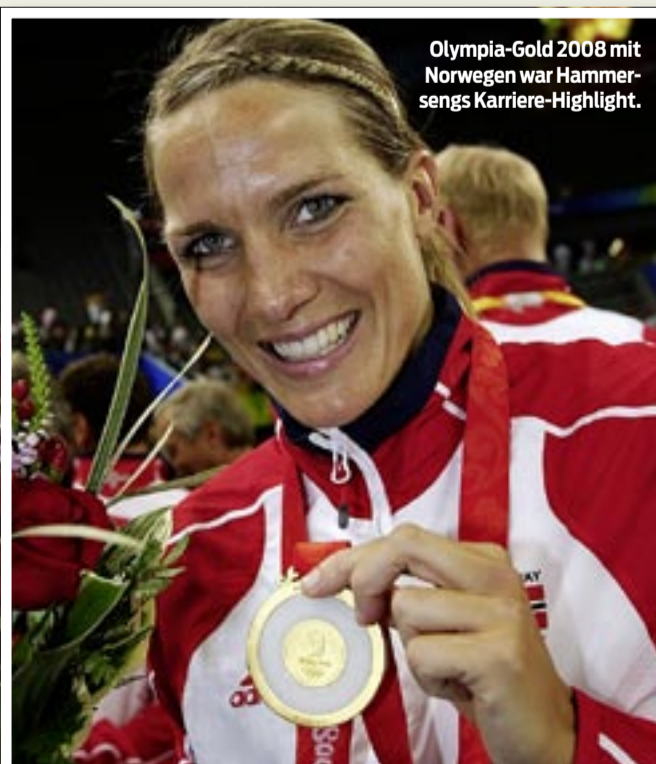
Olympia-Gold 2008 mit Norwegen war Hammersengs Karriere-Highlight.